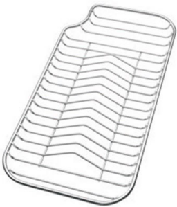
Rejilla portaplatos inox 8100 115