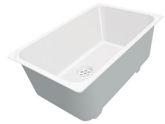
Cubeta blanca 8153 100