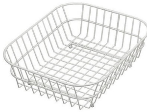
Cesta blanca de acero inoxidable 8612 000