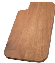
Tabla de corte de madera Iroko 8643 115